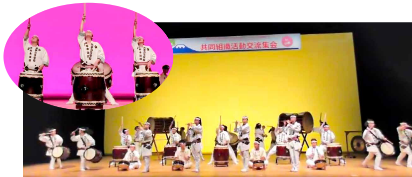
オープニング企画 笛吹高等学校すいれき太鼓部による演奏