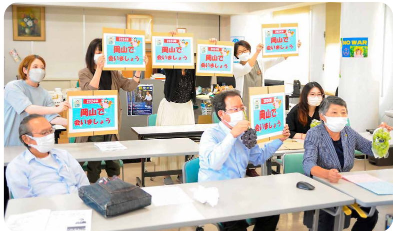
岡山特産のピオーネやメッセージボードを手に、次回開催県として挨拶をしました