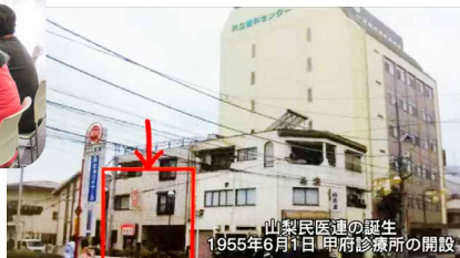
山梨勤医協の倒産から再建のたたかいと教訓

「富士のふもとに思いをほせ、コロナ禍に立ち向かい、つながり広げる共同の『わ』」をメインテーマに、9月11日(日)～12日(月)に第15回全日本民医連共同組織全国活動交流集会in山梨がオンライン開催されました。新型コロナウイルス感染症拡大のため2年の延期を余儀なくされ、昨年のプレ企画に続き待ちに待った本番となりました。岡山からも職員や組合員さん達約105名が、事業所の集合会場や自宅から参加をしました。