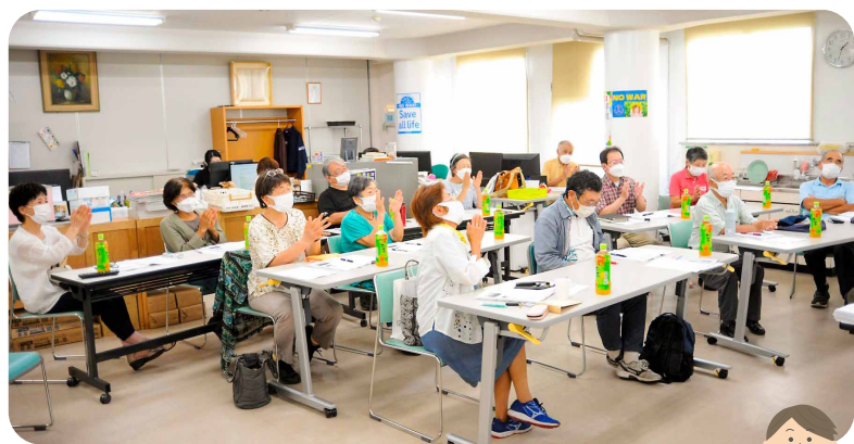
倉敷会場から現地山梨会場に大きな拍手!