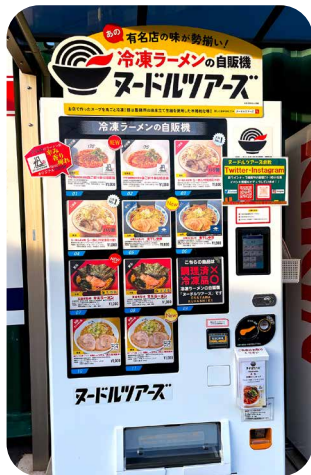
倉敷市連島町に設置

私はラーメンが大好きで、よくラーメン屋さん足を運んでいます。特に好きなのは、「二郎系」や「家系」と言われるこってりとした醤油豚骨スープのラーメンです。しかし今回ご紹介するのはラーメン屋さんではありませんが、「ラーメン