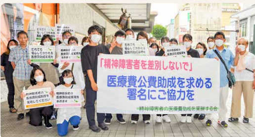
大勢で頑張った天満屋岡山店アリスの広場での署名活動

そんなある日、「岡山医療生協70周年あなたの夢叶えますプロジェクト」の文字が目飛び込んできました。「メイクセラピーを医療現場で行いたい」と思っていた私にチャンスが来たのです。小説並みに想いを書き、提出した結果、採用され、2023年には法人内でメイクセラピープロジェクトを立ち上げることができました。現在、メイクセラピーを知って、感じていただくための活動のひとつとしてセミナーを行っています。メイクは性別や年齢などに関わらず、どんな時も気持ちを上げてくれる力を持つていると感じます。近い将来、民医連ならではの新しい分野でメイクセラピーが患者さんの気持ちを応援する、そんな日が来ることを願っています。