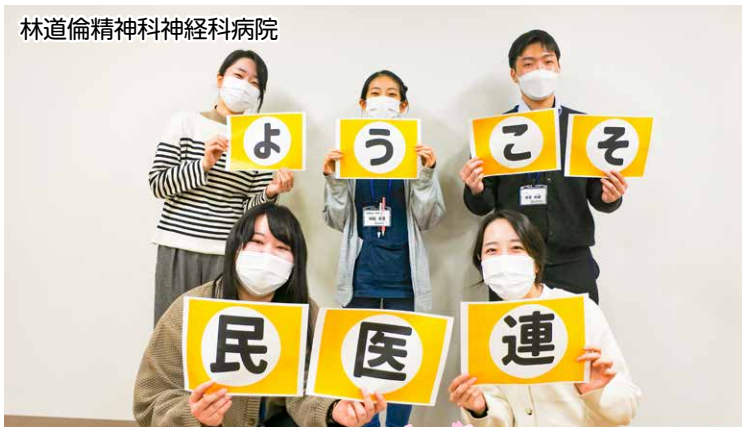
林道倫精神科神経科病院