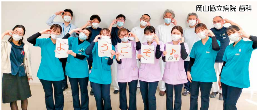
岡山協立病院 歯科