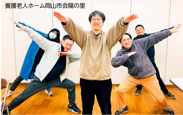
養護老人ホーム岡山市会場の里

岡山県民医連は、だれもが安心してかれ、患者さんの立場に立った良い医療を目指して、1963年に結成されました。地域の声を大切に医療・介護を実践し、現在は病院・診療所のほか、介護事業所、保険調剤薬局、事業協同組合、看護専門学校などがあります。これらの事業所は民医連綱領という理念でつながり、医療・介護、平和、社会保障、経営、教育、後継者育成などの活動に、多くの職員が取り組んでいます。