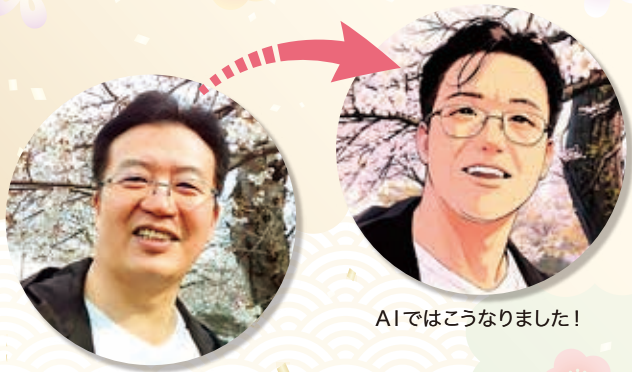
AIではこうなりました!