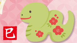
岡山県民医連 事務系職員交流集会 2024年11月16日(土) 岡山県生涯学習センター 情報・創作棟2F・大研修室にて

6年ぶりの集合開催!! 岡山県民医連の事務集団71名が集い、 法人・事業所の枠を越えて学び、交流し、 有意義で楽しい時間を過ごしました!!